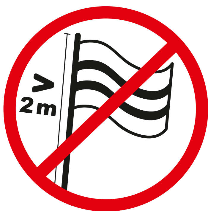
Fahnen u. Transparentstangen länger als 2m, übergroße Spruchbänder poles for flags and banners longer than 2m, oversized banners