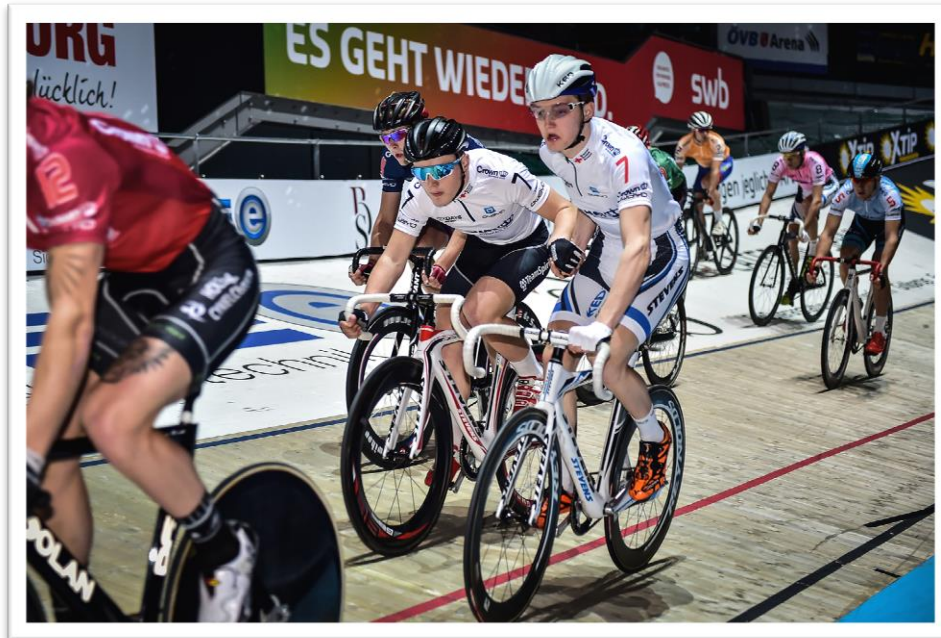
U23-Cup während der SIXDAYS BREMEN 2016, Foto: Arne Mill

Ein Sechstagerrennen ist eine Bahnradsportveranstaltung mit unterhaltendem Rahmenprogramm. Dabei finden über den Zeitraum von sechs Tagen verschiedene Radwettbewerbe statt. Über 6 Tage kommen rund 60.000 Besucher in die ÖVB-Arena Bremen um Spitzensport der Weltklasse zu verfolgen.